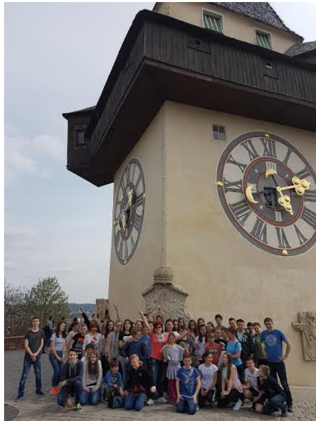
Aprila 2016 smo obiskali Gradec in Čokoladnico Zotter.

Na naši šoli v okviru izbirnega predmeta nemščine vsako leto organiziramo ekskurzijo v Avstrijo (Dunaj, Celovec, Salzburg, Gradec ...).